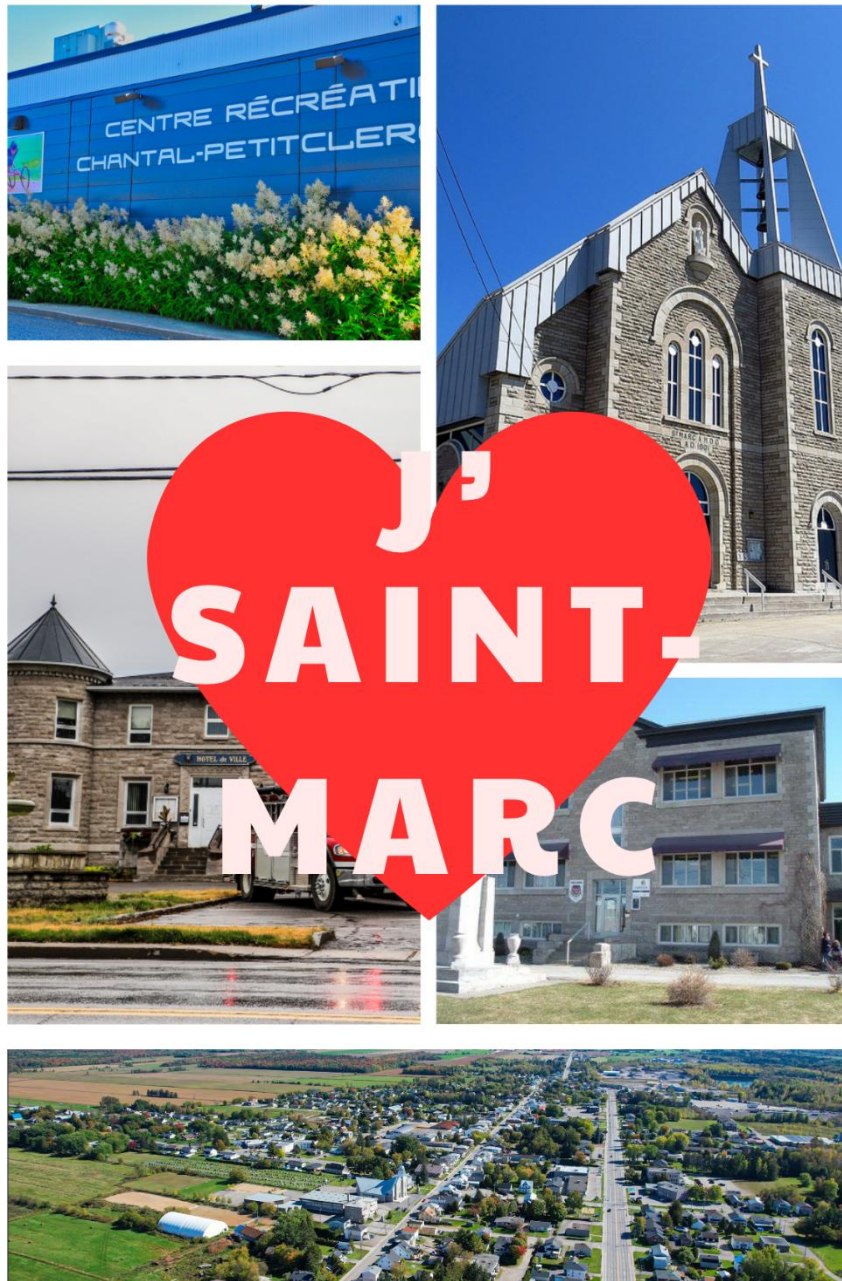
RALLYE HISTORIQUE DU 125E