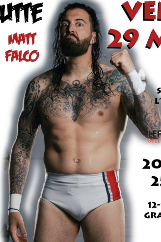
TABLE VIP POUR 8 PERSONNES PRÈS DU RING INCLUANT DEUX CONSUMMATIONS ET CROUSTILLES 400$ AUPRÈS DES MEMBRES DE LA FONDATION

12-17 ANS : 10$ À LA PORTE. GRATUIT POUR LES ENFANTS DE MOINS DE 12 ANS.